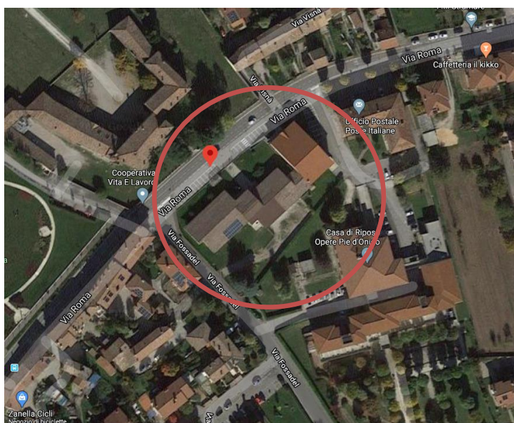
Scuola Primaria di Pederobba